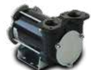
Bomba eléctrica 12/24