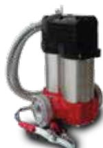
Bomba BiPump 12/24 V