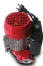
Bomba Devil 55 230 V