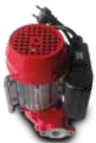
Bomba Devil 55 230 V