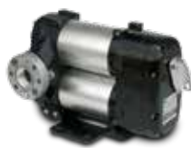
Bomba BiPump 12/24 V