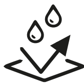
RESISTENCIA AGENTES EXTERNOS