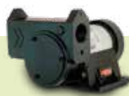
bomba IRON-50 12 VCC