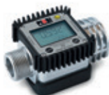
Cuentalitros K24 ATEX