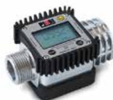
Cuentalitros K24 ATEX