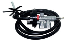
kit de aspiración