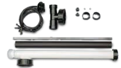
kit base de unión